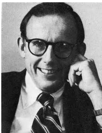
С. Хантингтон (1927 – 2008)

якобы, «претензий» к другим, Запад стремится только к одному: избежать прямых вопросов к самому себе . И делается это ради сохранения все еще благоприятного для него статус-кво в мировой экономике, политике и праве. Очевидно, что отнюдь не «терпимость», а только понимание специфики представителей другой культуры: их религии, традиций, привычек, национальных особенностей и пр., способно стать основой для относительно безболезненного принятия их в лоно такой культуры, как западная. Но это невозможно без беспристрастного – научного (!) подхода к проблеме, который предполагал бы отказ от «политкорректных» (строго говоря – антинаучных) представлений о неком все