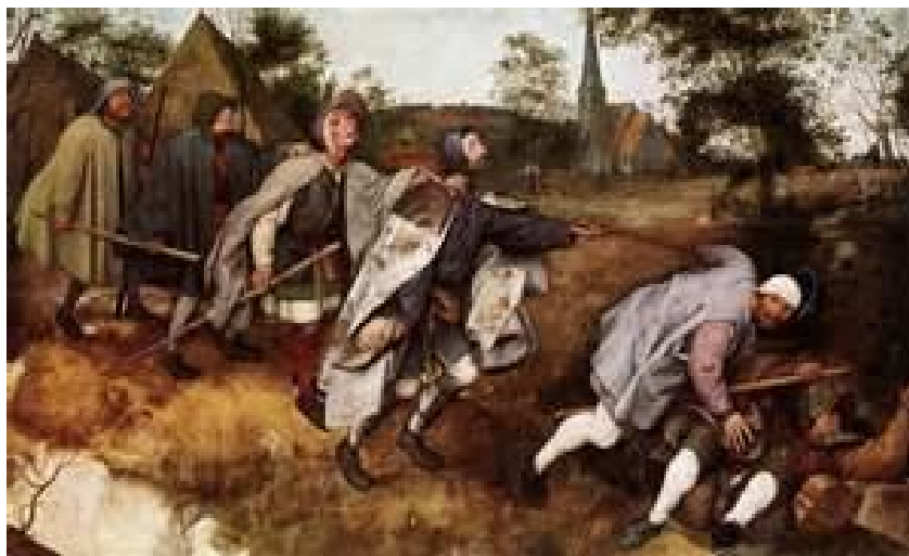
П. Брейгель-старший. Слепые.

11») * и тем, что США, ЕС и Япония «уже в полной мере реализовали свой потенциал восхождения» (курсив мой – Б.М.), когда при всем желании США сохранить доминанту «монополярной модели», ее можно отнести преимущественно к 90-м годам прошлого столетия.