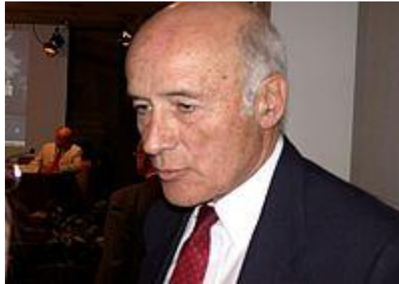
Проф. Дж. Най

лой» (“ smart power ”), 1 вступить в конструктивный альянс с новыми «восходящими странами», будет рассмотрен ниже. Однако уже сейчас стоило бы прислушаться к мнению колумбийского ученого К. Гарсиа Тобона, который обвинил цивилизацию Запада в «антимодернизме». «Если западный мир не спустится со своего эгоцентричного пьедестала, не преодолеет собственный аутизм и не начнет воспринимать мир как вместилище различий, если он по-прежнему будет навязывать свое господство, то совершит крупную историческую ошибку» 2 .