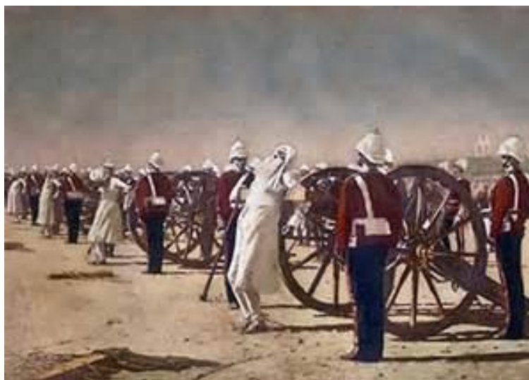
В.В. Верещагин «Подавление индийского восстания англичанами»

человека направлено на приобретательство, которое становится целью его жизни.