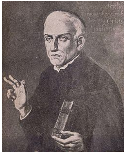
О. Жозе де Аншиета

Сердцевиной бразильской доктрины МП можно считать признание невозможности изменить международно-правовую норму в одночасье, на потребу конъюнктурного интереса, либо «оперативно» истолковать ее вопреки изначально закладывавшемуся содержанию. В книге «Американская иллюзия» (1895) бразильский историк и юрист Эдуардо Прадо (1860-1901) провел четкую грань между юриди-