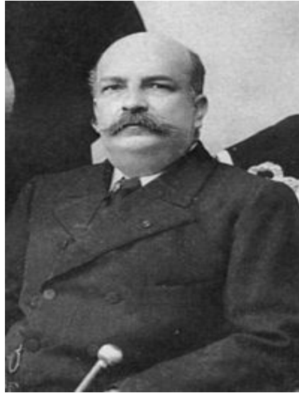
Ж.-М. да Силва Параньос, барон де Рио-Бранко (1845-1912)

Боливара возникла мысль, достойная стать основой внешнеполитической доктрины любого современного государства: «наименьшее зло – это наибольшее благо» .