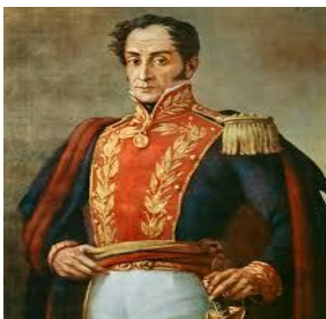
Симон Боливар (1783 – 1830)

стремление навязывать их извне. Задолго до Ф. Фукуямы («Сильное государство»), С. Хантингтона и др. он постулировал необходимость предварительного наличия сильной государственной власти как гарантии жизнеспособности демократического государственного устройства и независимой внешней политики. При этом «Освободитель» был далек от «юридического романтизма» и не критичного взгляда на природу человека, как бы возвращая тем самым в лоно политико-юридического дискурса понятие «первородного греха», которое было выведено за скобки сторонниками школы «отца» британского позитивизма – И. Бентама. «Несомненно, достойны похвалы люди, все устремления которых направлены к созданию законных институтов и социальному совершенству, но можно ли утверждать, что люди уже достигли вершин мудрости, что они обладают всеми добродетелями, что их жизненной потребностью является слияние власти и правосудия?» 1 . На этом основании у