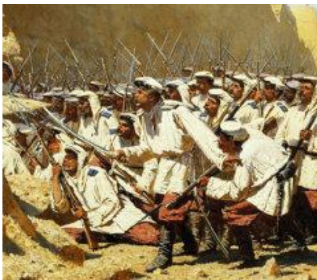
В.В. Верещагин. «У крепостной стены» («Пусть войдут!»). Фрагмент картины.

зано с вопросами их национального самосохранения. Что касается методов, то вряд ли массовые казни британцами участников индийского национального восстания в 1858 г. * , истребление ими в концлагерях мирных жителей Трансвааля и Оранжевой республики во время англо-бурской войны 1899 – 1902 гг. или кровавое подавление американцами восстания на Филиппинах в 1889 г., хоть чем-то отличались в лучшую сторону от последствий взятия войсками генерала Скобелева крепости Геок-Тепе в 1881 году.