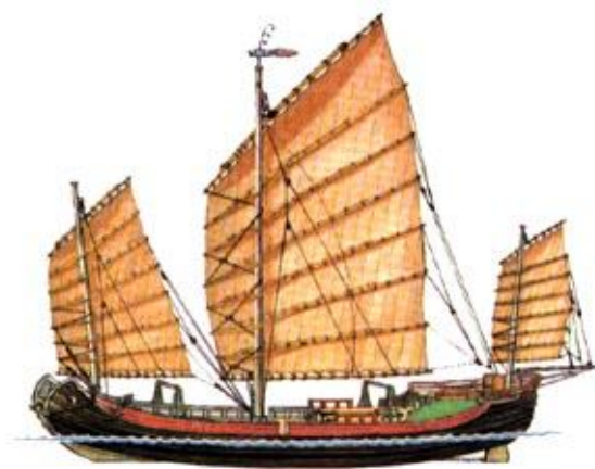
Китайская джонка, XIV век

Китайцам европейцы были обязаны появлением бумаги, компаса, пороха, навигационных приборов и водонепроницаемых переборок (в европейском кораблестроении они стали применяться только со второй половины XIX столетия!), арабам – развитием математики, астрономии, архитектуры, философии и медицины. Над секретом «греческого (византийского) огня», схожего по характеристикам с напалмом, современные ученые бьются до сих пор. Выстраивая средневековые европейские столицы, Карл Великий стремился копировать наиболее удачные образцы византийской архитектуры.