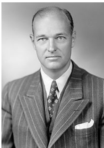
Дж. Ф. Кеннан (1904 – 2005).

Италия, Испания и Португалия, в новом свете – страны Латинской Америки» 1 . В Латинской Америке католическая религия, культура и основанное на них правосознание сохранились до наших дней в своем наиболее чистом виде. Неудивительно, ведь большую часть своей истории эти страны пребывали на «периферии» мировой географии, истории, экономики и политики, начав активно участвовать в глобальных процессах лишь где-то с 70-х годов прошлого века.